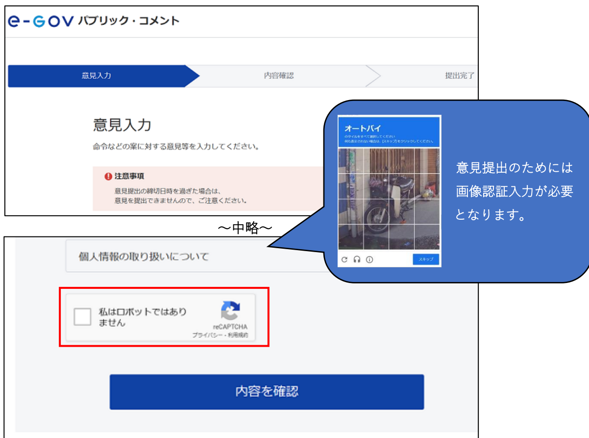
図 3-3 変更前の画像認証のイメージ

意見提出時にロボットではなく人間が意見提出していることの検証・判定を行うため、これまで reCAPTCHA (※1) を利用した「私はロボットではありません」のチェックや、画像認証が必須でした。ガバクラ移行後も同様の検証・判定は行いますが、利用者によるチェックや画像選択の操作が不要になります。