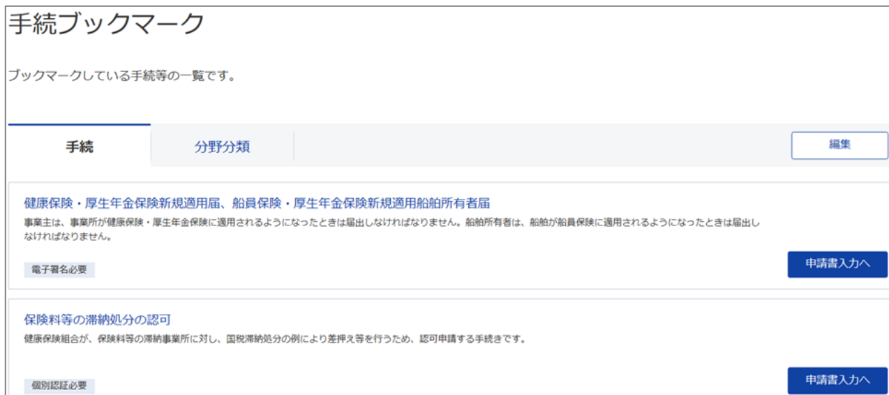
図 2-2 手続ブックマーク画面のイメージ

これまでは手続ブックマークに登録可能な件数は 99 件でした。切替後は手続ブックマークに登録可能な件数を 999 件に拡張します。