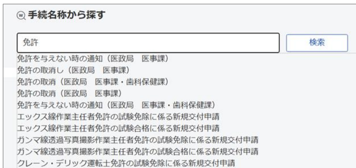
図 2-1 手続検索画面のイメージ

e-Gov 電子申請で手続検索を行う際、これまでは部分一致、完全一致の検索結果を表示する仕組みとしていました。切替後は、手続名称の入力中に、検索キーワードの候補が表示されるようになります。