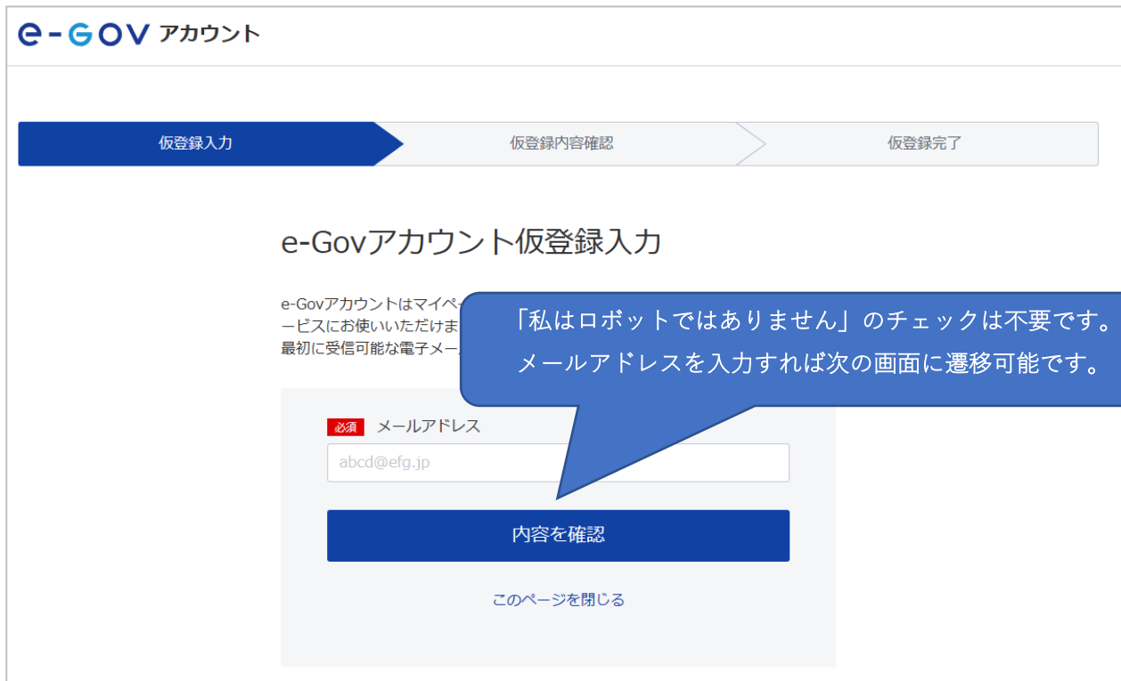
図 1-2 切替後の e-Gov アカウント仮登録入力画面のイメージ