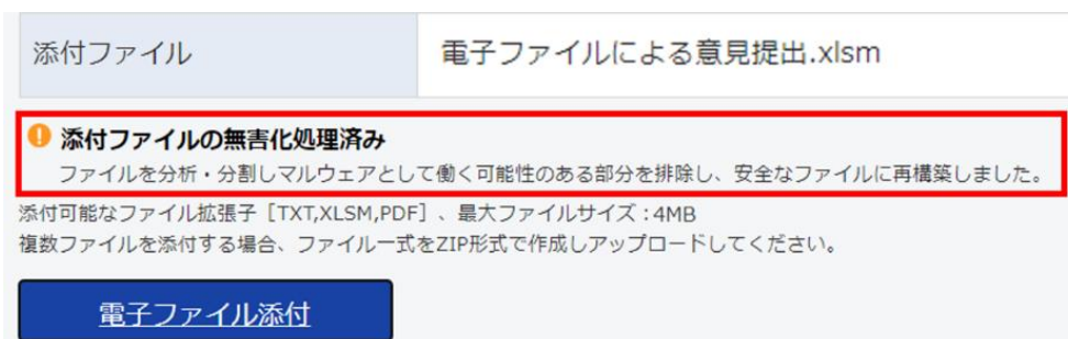
図 3-2 メッセージのイメージ

一方、セキュリティに問題がある場合は電子ファイルを添付することができませんのでご注意ください。