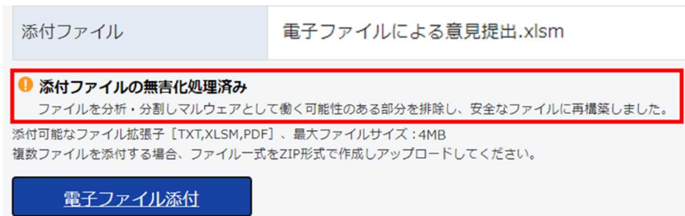
図 3-2 メッセージのイメージ

一方、セキュリティに問題がある場合は電子ファイルを添付することができませんのでご注意ください。