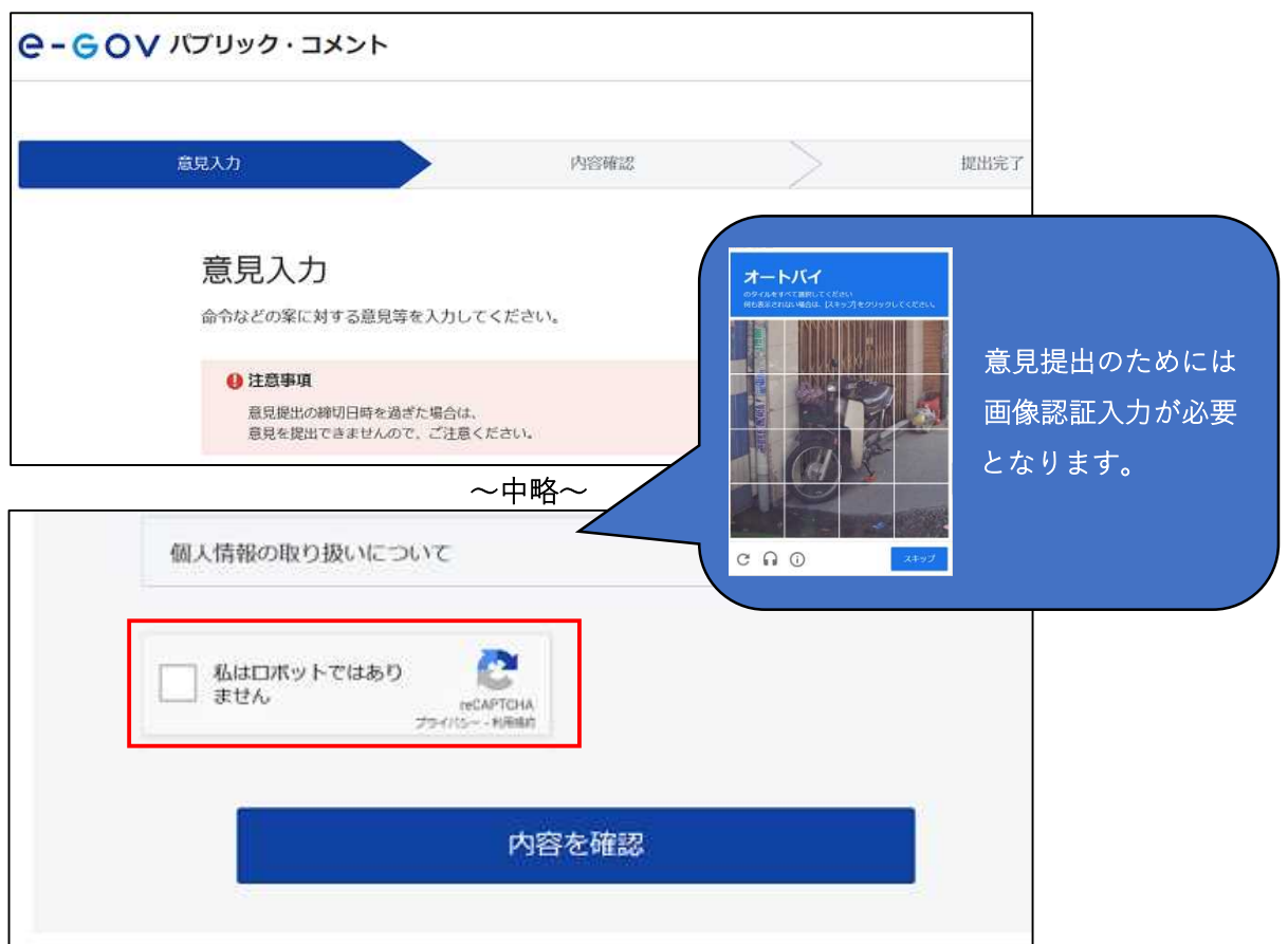
図 3-3 変更前の画像認証のイメージ

意見提出時にロボットではなく人間が意見提出していることの検証・判定を行うため、これまでは reCAPTCHA (※1) を利用した「私はロボットではありません」のチェックや、画像認証が必須でした。ガバクラ移行後も同様の検証・判定は行いますが、利用者によるチェックや画像選択の操作が不要になります。