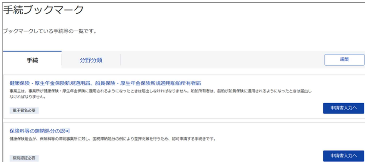
図 2-2 手続ブックマーク画面のイメージ

これまでは手続ブックマークに登録可能な件数は 99 件でした。切替後は手続ブックマークに登録可能な件数を 999 件に拡張します。