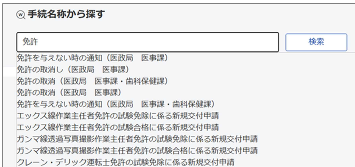
図 2-1 手続検索画面のイメージ

e-Gov 電子申請で手続検索を行う際、これまでは部分一致、完全一致の検索結果を表示する仕組みとしていました。切替後は、手続名称の入力中に、検索キーワードの候補が表示されるようになります。