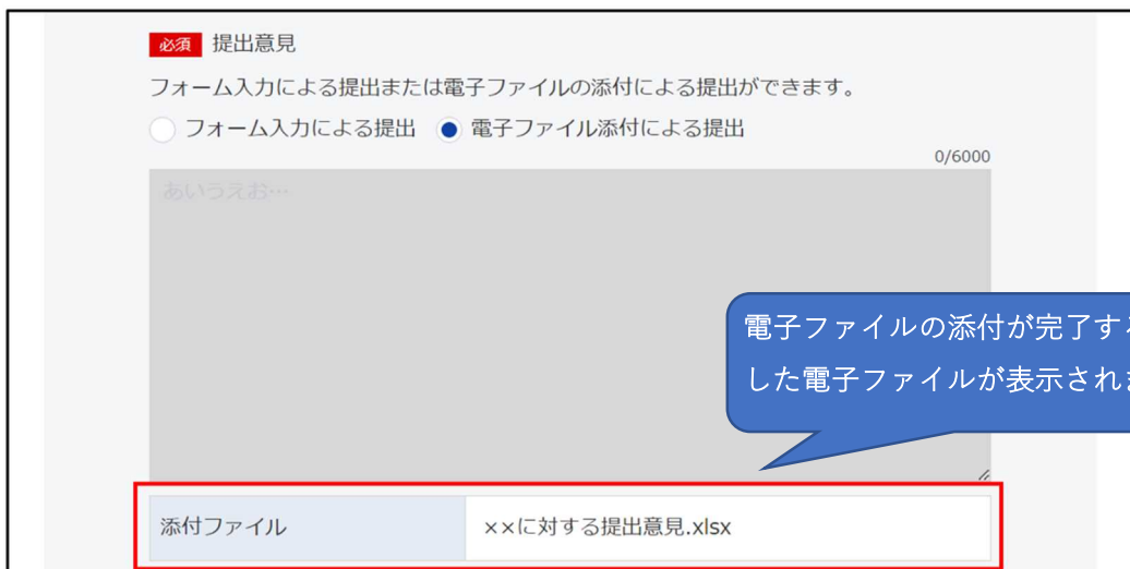
図 3-1 電子ファイルによる意見提出のイメージ