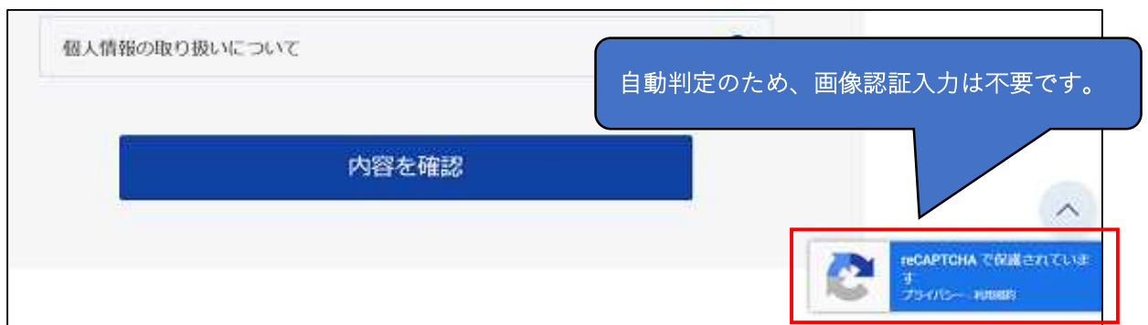
図 3-4 変更後の画像認証のイメージ