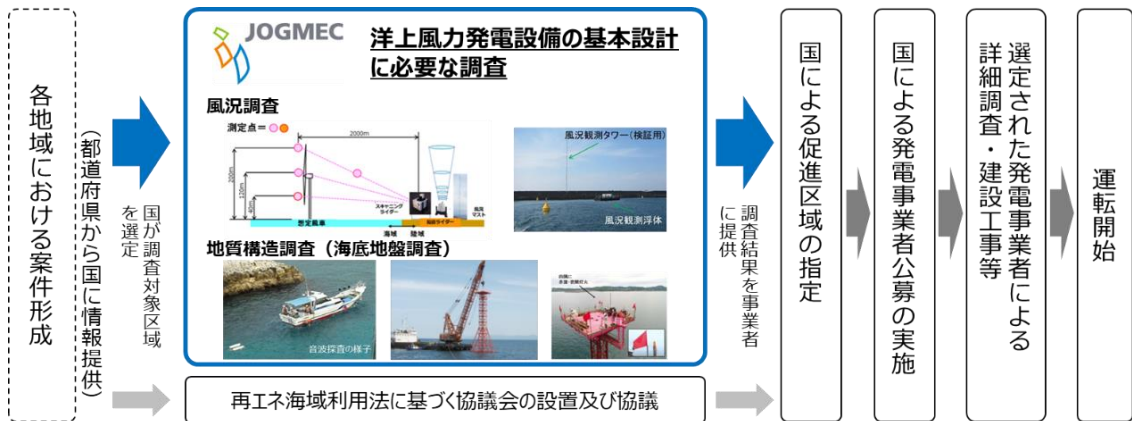
セントラル方式における案件形成プロセスとサイト調査の関係

必須事項を満たす区域については、本来であれば全て調査対象とすることが望ましいが、現実的には調査に係る予算や人員等のリソースに制約がある点を考慮することが必要である。そのため、考慮事項に掲げる内容を勘案して優先的に取り組む区域を選定する。その際、①に関しては漁業・航路等の利害関係者のほか、関係市町村や地域における理解の状況等も参考情報として考慮する。また、②は洋上風力発電の導入目標の実現の観点から出力規模のほか、事業性の観点から設備利用率に影響する風況についても加味するものとする。