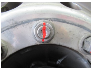
ホイール・ナットへのマーキング例