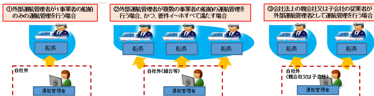
図4 運航管理者を外部委託できる形態

なお、外部の運航管理者が誠実にその職務を行わなかった場合等は、行政処分等の対象となり、委託を行った事業者も行政処分等の対象となることに留意する。