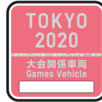
ステッカーのイメージ