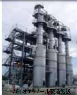
バイオエタノール製造施設