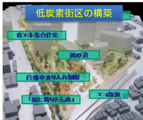
低炭素街区の例（摂津市）